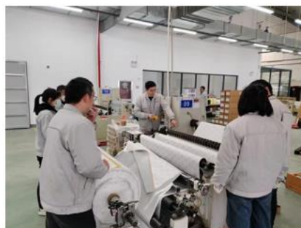
设备安全隐患识别排除培训