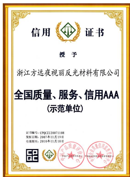
图 3.3-1 社会认可荣誉证书（示例）

公司成立以来，严格遵守各项法律法规，倡导诚信经营，创立至今，未收到一起经营、环境、安全、质量方面的投诉，如：被浙江省科学技术厅认定为“高新技术企业”，2021年由浙江省经济和信息化厅颁发的“浙江省重点技术创新项目计划”，2022年获得了由浙江省科学技术厅颁发的“浙江省“专精特新”中小企业”、“全国质量、服务、信用AAA（示范单位）”等称号，如图 3.3-1 所示：