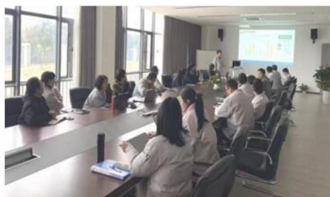
精益管理项目培训