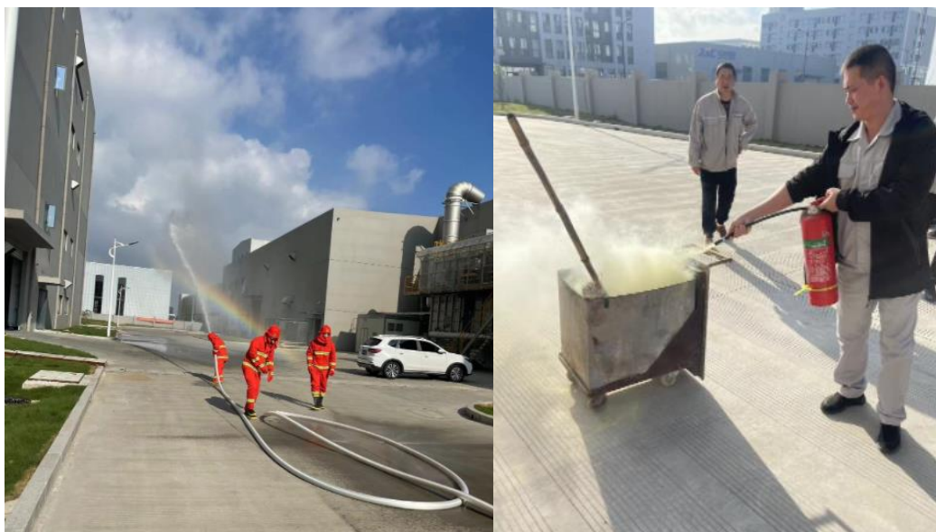
图 6.3-01 2022 年火灾应急演练记录

公司每年举行消防演练和各种灾害应急演练。公司制订了《危险源识别与评价控制程序》、《触电事故应急预案》等 6 个突发环境事件应急预案等，对火灾、中毒、机械、触电等均有相应的应急措施，并成立了应急指挥中心和应急救援专业组。